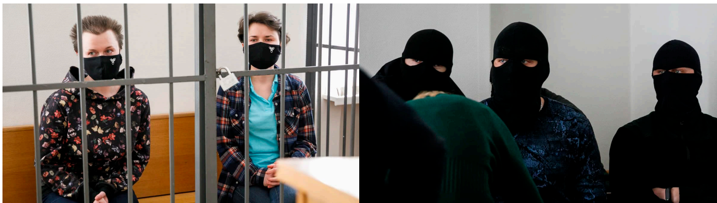
Обвиняемые и пострадавшие от насилия на суде в Минске. В балаклавах - пострадавшие.