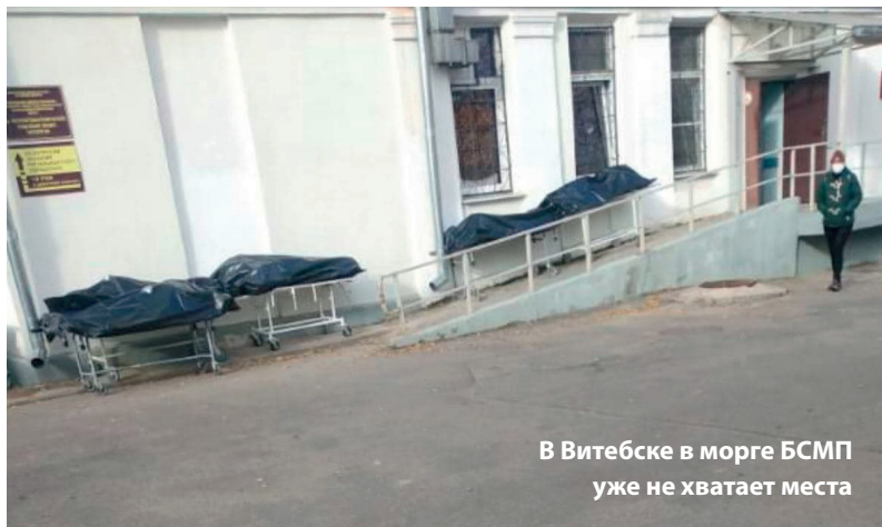
В Витебске в морге БСМП уже не хватает места