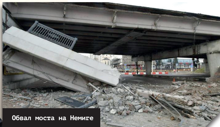
Обвал моста на Немиге