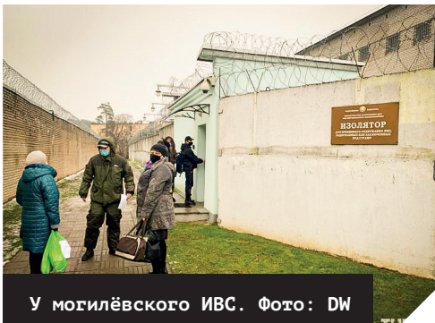
У могилёвского ИВС.

Первые дни после 25 марта условия содержания были обычными. Однако