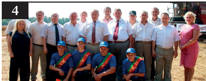
4 работника и 14 начальников.