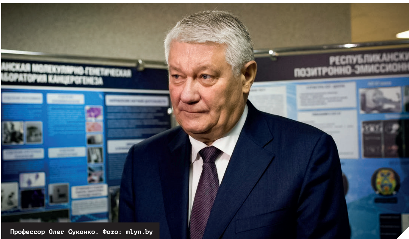
Профессор Олег Суконко.

Минздрав Беларуси до сих пор отказывается комментировать эти факты. Также, в отличие от других стран, в Беларуси не публикуют средний возраст умерших от ковида. Судя по данным о смертях в СМИ, возраст этот в Беларуси, увы, невысокий — одних только медиков (то есть людей в трудоспособном возрасте) от ковида умерло более 146 человек. В то время как в Европе средний возраст умерших от ковида колеблется от 78 до 80 лет.