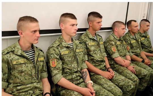
Бойцы погранзаставы Дивин.