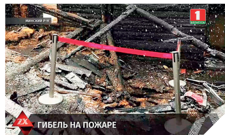
ГИБЕЛЬ НА ПОЖАРЕ

Тушением пожаров у нас занимается МЧС. В интервью БЕЛТА глава белорусского МЧС Синявский не смог ответить, почему у нас такие аномально высокие цифры смертности на