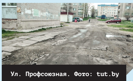
Ул. Профсоюзная.

Хватит чиновникам бездумно распоряжаться нашими налогами! На ремонт памятника Ленину в Могилёве ушло 80 тыс. долларов, на строительство Триумфальной арки на Минском шоссе — 2 млн. долларов! В то же время в двух шагах от этой арки на улицах Профсоюзной и Краснозвёздной дороги, дома и дворы выглядят как после войны. Такая же картина на Юбилейном, на Ямницком, на Рабочем, на Урожайной, в Соломинке, почти во всём частном секторе... Да и в центре — переулок Коперника, улица Маркса... И вообще Могилёв имеет репутацию областного центра с самыми плохими в Беларуси дорогами. Но на всё это, как заверяют местные власти, в бюджете денег нет. А на показуху у них деньги есть всегда.