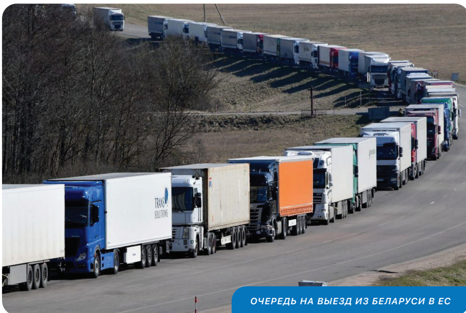
ОЧЕРЕДЬ НА ВЫЕЗД ИЗ БЕЛАРУСИ В ЕС

— Хорошо было бы построить большую платную стоянку для фур. Вот есть участок, где несколько лет назад лес