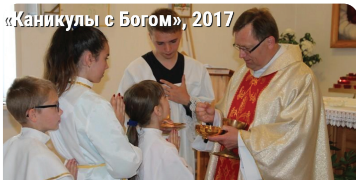
«Каникулы с Богом», 2017