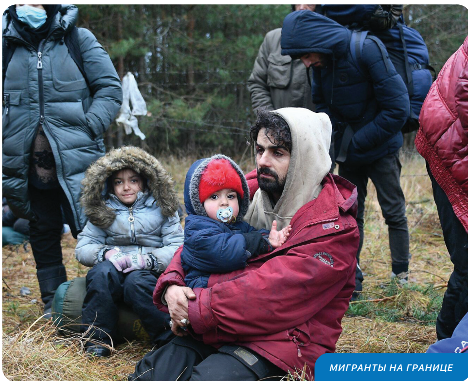
МИГРАНТЫ НА ГРАНИЦЕ

«Мы шли к границе 4 часа. У одного из них был с собой болторез. Он прорезал забор на белорусской границе. Приехали белорусские милиционеры с собаками. Они открыли наши сумки. У меня было с собой 16 пачек сигарет, они