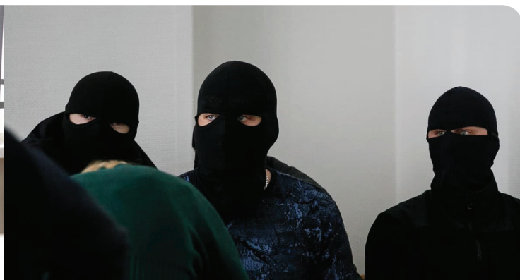
ОБВИНЯЕМЫЕ И ПОСТРАДАВШИЕ ОТ НАСИЛИЯ НА СУДЕ В МИНСКЕ. В МАСКАХ — ПОСТРАДАВШИЕ...