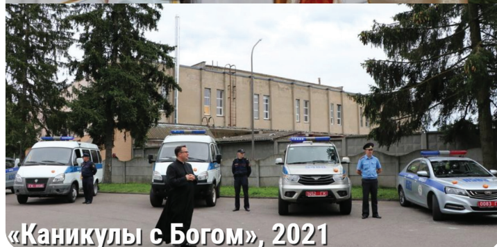
«Каникулы с Богом», 2021