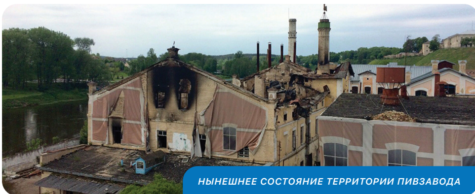
НЫНЕШНЕЕ СОСТОЯНИЕ ТЕРРИТОРИИ ПИВЗАВОДА