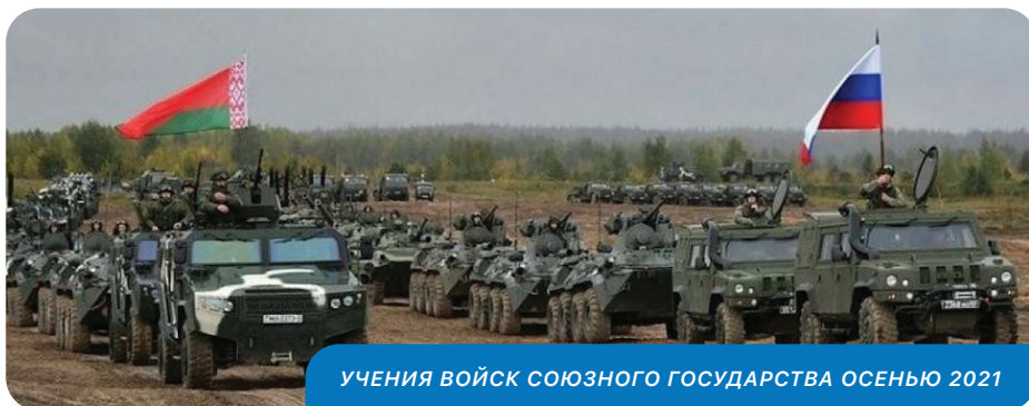
УЧЕНИЯ ВОЙСК СОЮЗНОГО ГОСУДАРСТВА ОСЕНЬЮ 2021

Для этого надо просто испортить бюллетень.