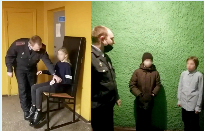
Дети в РОВД и в камере временного содержания

Такие ли знания наши дети должны приносить из школы?