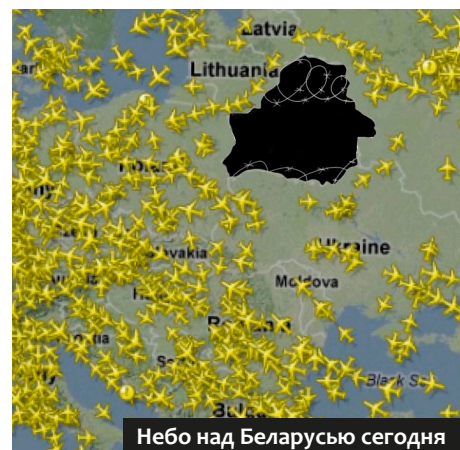
Небо над Беларусью сегодня

Если не будет реакции, то чей борт будет следующим? Что помешает сообщить о бомбе на борту и захватить самолёт с президентом другой страны? Что помешает странам с диктатурой при помощи истребителей захватывать залож-