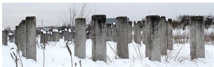
Долгострой школы в Чёнках

Остроты этому вопросу добавляют планы градостроителей возвести в Чёнках и соседней деревне Севруки многоквартирные дома на 4 700 жителей. Единственным вариантом для чёнковских новосёлов станет школа в Хуторе, только дорога к ней будет пролегать через скоростное шоссе.