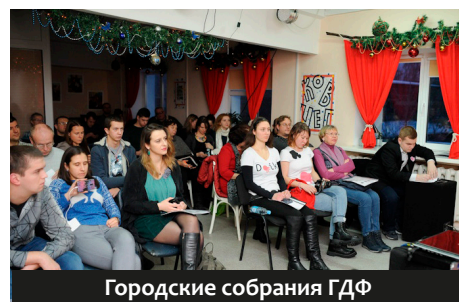
Городские собрания ГДФ

— Я до сих пор не знаю причин ликвидации. Ещё два года назад мы проводили арт-фестивали, краеведческие форумы, организовывали дни деревни, разработали и торжественно открыли историческую карту «Чырвоная Кастрычніца», о чём снимали и писали региональные и республиканские госСМИ, а сегодня нас ликвидируют.