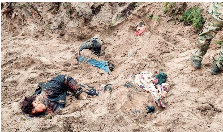
Расстрелянные оккупантами мирные жители в Мотыжине. Убиты выстрелом в затылок. У некоторых руки связаны за спиной

В 20 км от Киева, по данным Минобороны Украины, найдено «4-5 трупов обнажённых