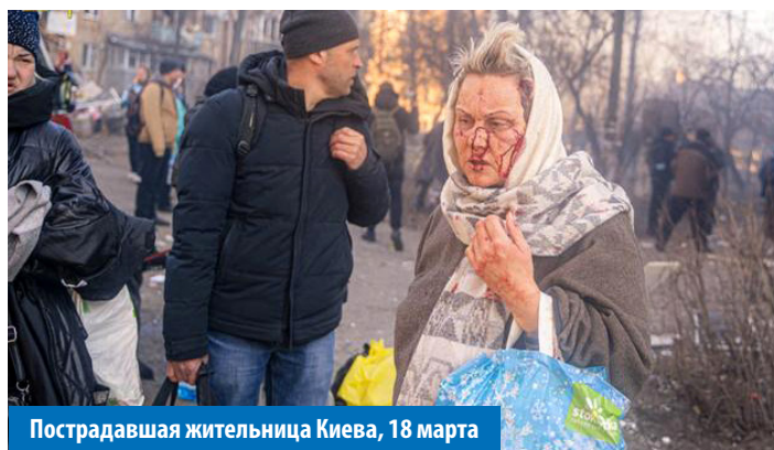
Пострадавшая жительница Киева, 18 марта

Часто россияне даже не думают винить свои власти, развязавшие войну. Это удивительно, но они действительно считают, что виноваты американцы. Хотя, как мы все знаем, именно российские войска заходили, в том числе с территории Беларуси, и бомбили