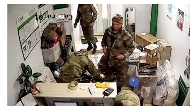
Российские военные отправляют вещи, награбленные в Украине

подъехали к местному ТЦ «Бобровский» и пытались найти проституток. По словам местных жителей, они говорили, что вернулись из Украины и что на руках у них «пачки долларов и гривен».