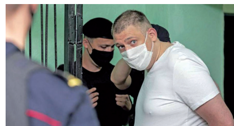
Сергей Тихановский в суде