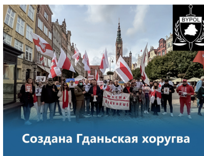
Создана Гданьская хоругва