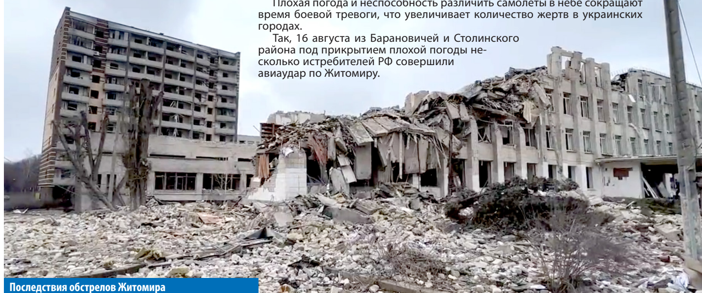
Последствия обстрелов Житомира

Так, 16 августа из Барановичей и Столинского района под прикрытием плохой погоды несколько истребителей РФ совершили авиаудар по Житомиру.