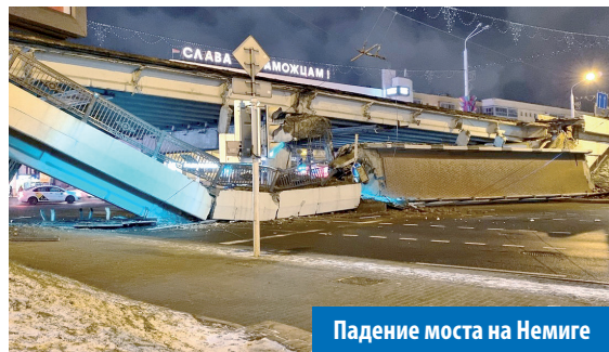
Падение моста на Немиге

Из-за санкций автопарк страны будет стареть, из-за плохого качества дорожного