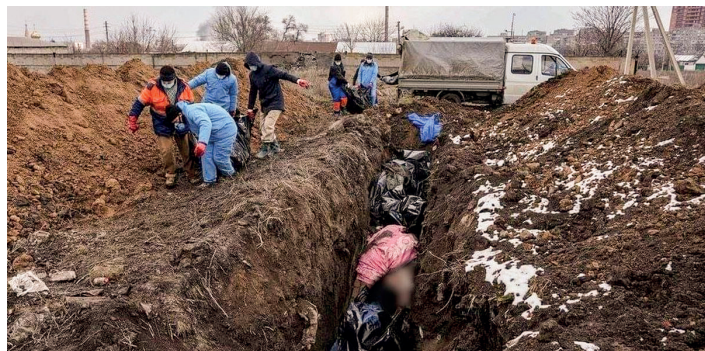
Массовое захоронение мирных жителей. Украина