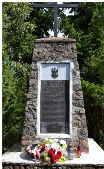
В деревне Стриевка Гродненской области снесли памятник солдатам Армии Крайовой

Лукашенко сейчас переписывает белорусскую историю — для оправдания собственных преступлений и преступлений своего хозяина Путина. Он давно живёт в своём мире, где прав только он. Для него нет ничего святого, он даже доказался до осквернения могил — это мародёрство в худшем смысле слова! Он настолько погряз во лжи, криминале и бесконечной подлости, что у нормального человека это вызывает омерзение.