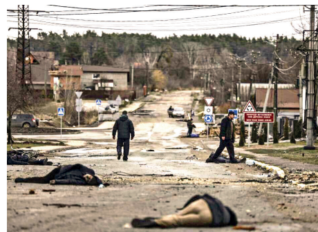
На улицах Бучи

Российская сторона утверждает, что произошедшее в Буче — «провокация». Но сейчас «в небе много глаз». Организации по всему миру, в том числе в России, используют спутниковые снимки для наблюдения за лесными пожарами, состоянием урожаев или отслеживания передвижения судов. Поэтому спутников, принадлежащих частным компаниям, очень много. Эти компании за время войны в Украине опубликовали немало спутниковых снимков зоны конфликтов. Так, спутниковые снимки Maxar Technologies сняли улицы Бучи в период оккупации городка войсками Путина, в марте 2022 года. Трупы лежат в том же порядке, в тех же позах и положениях, которые фиксирует и видеосъёмка из машины, сделанная после ухода российских войск. Также на снимках видно — первые признаки раскопок братской могилы возле церкви Андрея Первозванного зафиксированы 10 марта, когда город ещё контролировали россияне.