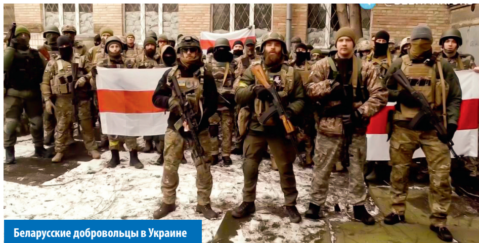
Белорусские добровольцы в Украине

Это слова не какого-то телеведущего или военного эксперта. Это слова белоруса, вступившего в Батальон Кастуся Калиновского и потерявшего в обороне Киева не только ногу, но и товарища. Тоже белорус.