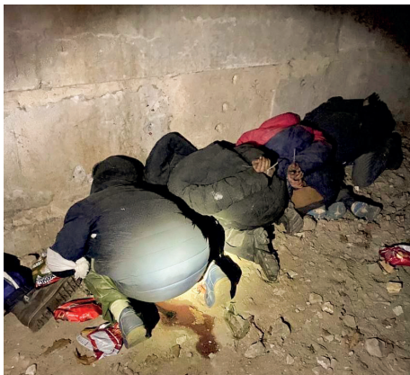
Убитые выстрелом в затылок в подвале украинцы

попали осколки. Потом принесли девятилетнюю девочку, на досках, перевязанных полотенцем.