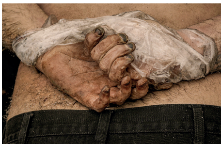
Тело мужчины со связанными руками, лежащее на земле в Буче