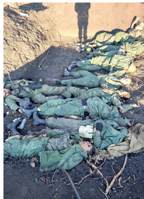
Брошенные тела российских солдат

С первых дней войны МВД Украины создало сайт «РФ 200 Ищу своих», где публикуются фото, видео и документы пленных и убитых российских солдат, есть телеграм-каналы с аналогичной информацией. Пока «русские своих не бросают», украинцы хоронят трупы захватчиков и проводят мероприятия по документации, чтобы в дальнейшем идентифицировать останки и передать родным.