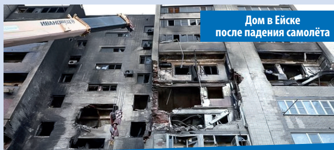
Дом в Ейске после падения самолёта

Простые люди в это время выплачивают неподъёмные кредиты за себя, за ОМОН, судей и прокуроров. Ещё потеряем?