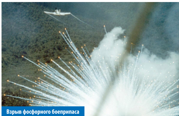
Взрыв фосфорного боеприпаса

Украинская армия продолжает сопротивление, в то время как русские используют запрещённое оружие — фосфорные боеприпасы. Их применение запрещается Конвенцией ООН в городской застройке, поскольку от них страдает мирное население.