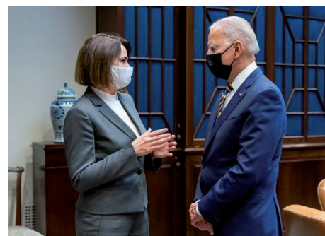
Светлана Тихановская и Джо Байден, 28 июля 2021 года