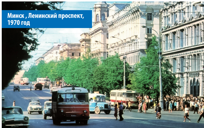
Минск, Ленинский проспект, 1970 год