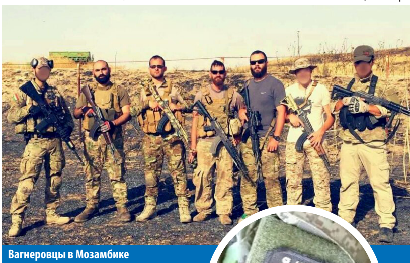
Вагнеровцы в Мозамбике

Также возможно, что Лукашенко уже не доверяет своему ОМОНу, на штыках и дубинках которого держится его власть, и хочет с помощью новых отмороженных головорезов упрочить свою безопасность. Он и так 28 лет идёт по трупам.