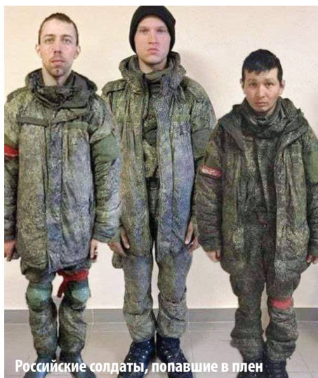
Российские солдаты, попавшие в плен

всё не так. Наши войска по городам ху...ят, по людям, даже не смотрят. Харьков наши бомбят. Не украинские войска, а наши бомбят! По домам жилым лупят! А нам в России совершенно другое говорили.