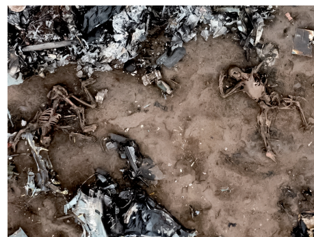
Останки оккупационных военных со сбитого вертолета возле города Макариев Киевской области, 9 апреля 2022 г.

Уже четыре месяца идёт война в Украине. Война тяжёлая, с большими жертвами с обеих сторон. Гибнет гражданское население Украины. Есть статистика по погибшим украинским детям, их сотни. На фоне трагических новостей нет-нет да и раздастся боевой клич «президента» нашей страны. Вот последняя цитата: «Если они ударят по Мозырю, то мы ударим по Киеву».