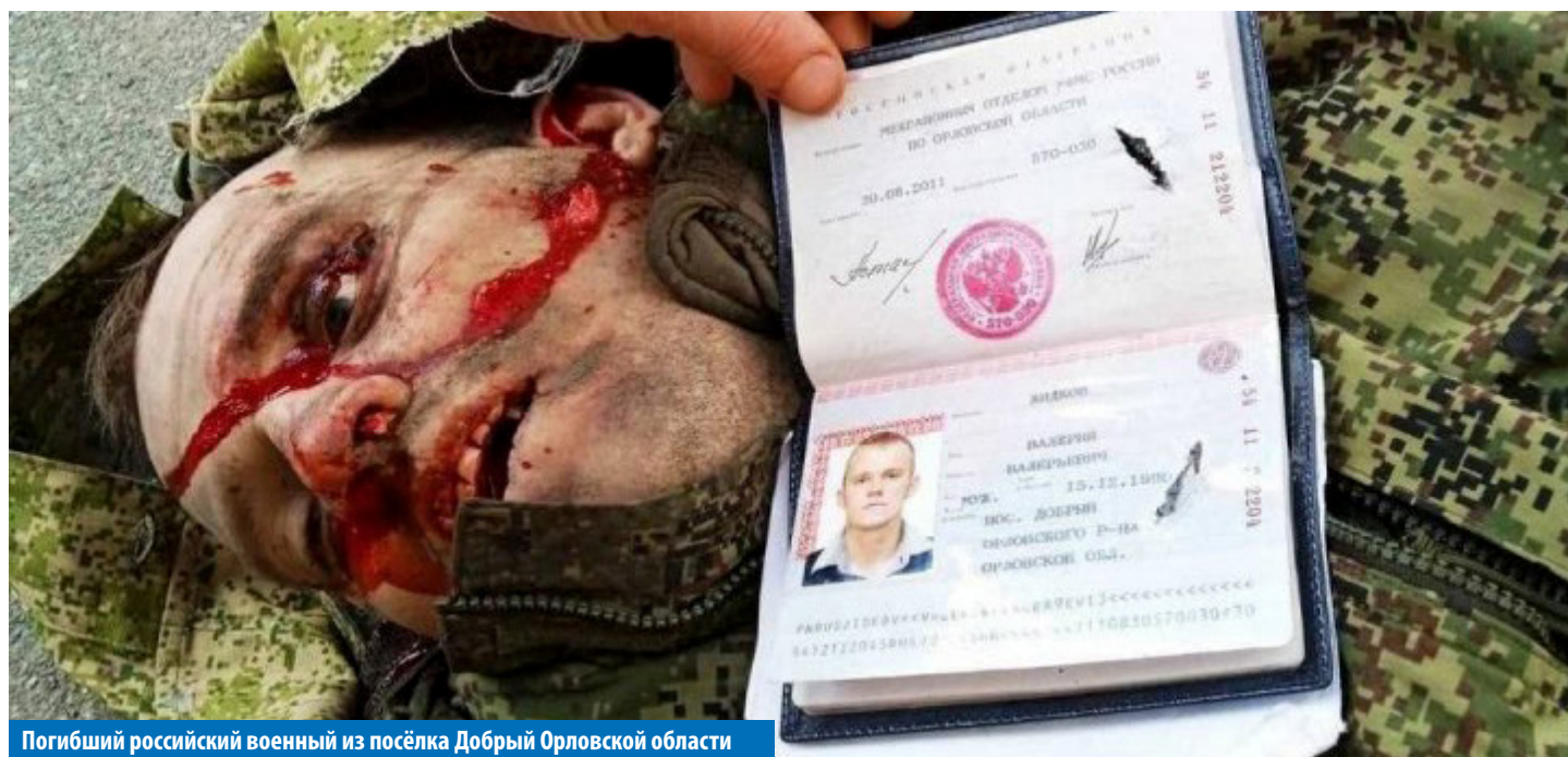
Погибший российский военный из посёлка Добрый Орловской области

Сейчас главная тема, которая тревожит белорусов, — пошлёт ли Лукашенко нашу армию воевать в Украину? С начала войны Беларусь покинули около 30 тысяч белорусских мужчин, не желающих быть мобилизованными.