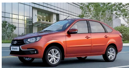
В Lada Granta Classic нет подушки безопасности, систем ABS, ESC и ESP и преднатяжителей ремней безопасности.

А что взамен? Разве что «Москвич», который будет выпускать московский завод Renault. Вы когда-нибудь ездили на авто без усилителя руля? Нет? Удовольствие, скажу вам, ещё то. Но будем снова привыкать, что сделаешь. Есть