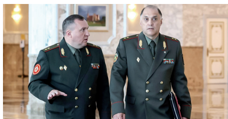
Виктор Хренин и Александр Вольфович

В начале октября Лукашенко поручил силовикам проводить встречи с рабочими. С тех пор прошло несколько таких встреч с участием госсекретаря Совбеза Александра Вольфовича и председателя КГБ Ивана Тертеля. Гастролирует с ними и министр обороны Виктор Хренин. Вместе они успели объехать Мозырский НПЗ, МЗКТ, МАЗ, БЕЛАЗ и др. Примечательно, что поехали они не по случайным местам, а именно по заводам, которые в случае войны будут работать на военные нужды и которые будут целями номер один для уничтожения, как критически важные объекты.