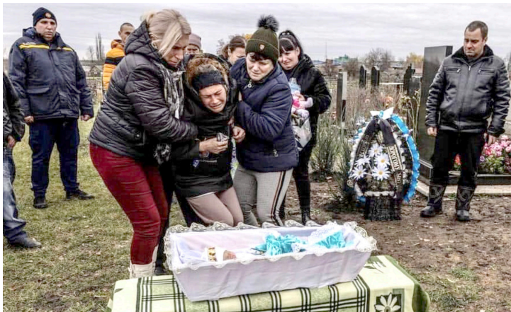
Похороны погибшего от обстрела ребёнка в Запорожской области

Это не первый случай, когда российские оккупанты обстреливают мирных жителей. В Орехове Запорожской области русские ракеты попали в пункт выдачи гуманитарной помощи: погиб социальный работник, много раненых. Ранее были обстрелены Мариупольский, Донецкий роддома. Постоянно под обстрелом Киев, Одесса,