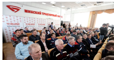
Работники Минского тракторного завода на конференции

Почти во всех выступлениях силовики объясняли, что приезжают на предприятия, чтобы объективно информировать рабочих о «сложной обстановке» вокруг страны. Видите, пропаганда не справляется. Теперь вояки сами вынуждены разъезжать и убеждать людей, у которых хватает ума не верить обману, хотя военные чиновники стараются объяснить свои выпущенные ракеты и дроны-камикадзе с территории нашей страны. Но все понимают, что режим сам тянет нас в войну. Но страшно им: боятся бунта на предприятиях, что работники выйдут как в 2020 и уже не остановятся.