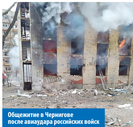
Общезитие в Чернигове после авиаудара российских войск

С уходом крупных производителей бытовой химии в России и у нас возникла