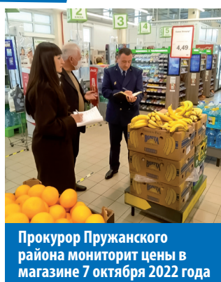
Прокурор Пружанского района мониторит цены в магазине 7 октября 2022 года

Может, есть ещё выход? Вот, например, прибыль белорусских организаций за 7 месяцев 2022 года выросла на 21,9%. Это больше, чем темпы инфляции. И на первый взгляд может показаться, что в этом и состоит резерв снижения цен. Но не тут-то было: почти пятая часть этих средств «съедается» расчётами по кредитам. Чистая прибыль по сравнению с прошлым годом выросла лишь на 6,5%. А ведь эти средства, которые также «съедает» инфляция, нужны бизнесу для модернизации материально-технической базы. В итоге мы выходим