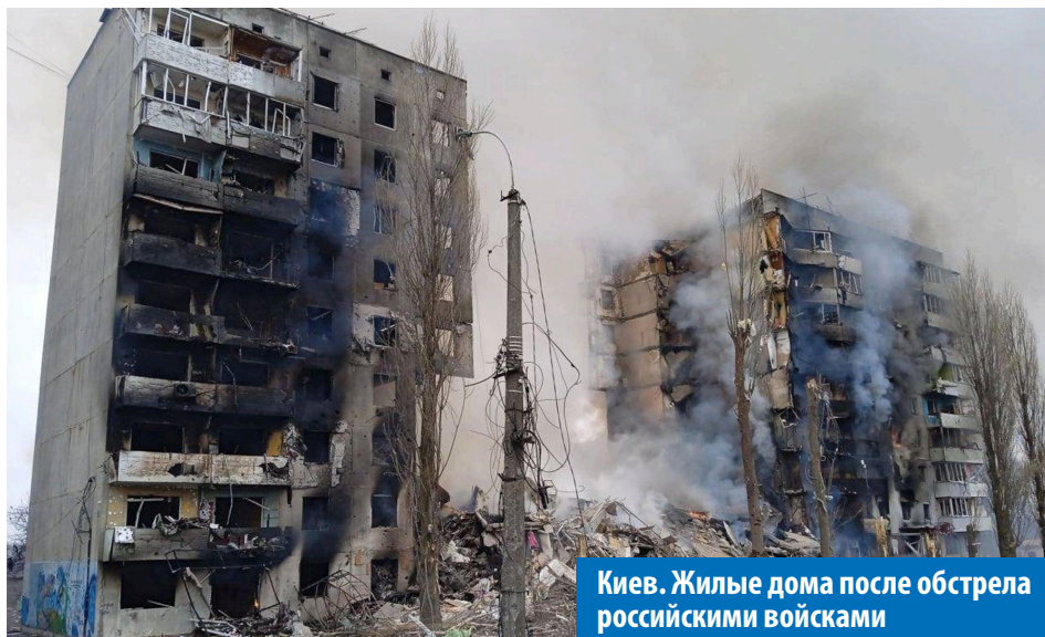
Киев. Жилые дома после обстрела российскими войсками