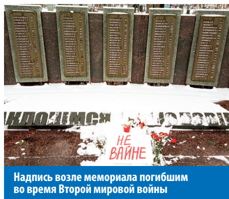
Надпись возле мемориала погибшим во время Второй мировой войны

А наши так называемые прокуроры, депутаты и министры стали соучастниками этого преступления. Теперь с их согласия с белорусских полигонов происходят пуски ракет по украинским городам. Лишь один пример: 17 марта ракета, выпущенная из Хойников, попала в общежитие по ул. Сазоненко в Чернигове. Под завалами погибли 35 человек, среди них 6 маленьких детей. Четверо (среди них ребёнок) лишились ног. Спасатели долго не могли приступить к разбору завалов из-за продолжающегося