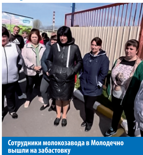
Сотрудники молокозавода в Молодечно вышли на забастовку

11 мая работники Молодечненского молочного комбината вышли на забастовку против снижения зарплаты. Было 800–1000 рублей, стало 200–300. Работники собрались недалеко от КПП и отказались возвращаться в цех. Это заснял проходящий мимо фармацевт Ростислав Чепурный. Снял и выложил в Интернет.