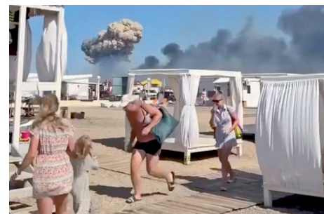
После серии взрывов на аэродроме Саки.

Однако точной версии о том, кто стоит за взрывами, нет. Есть только косвенные доказательства, некоторые факты, по которым мы можем строить своё мнение. Может ли