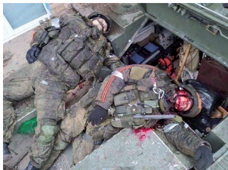
Российские солдаты, ликвидированные в Украине

Недавно пришли новости из ЛНР и ДНР. Погибшие из этих областей солдаты не считаются достойными компенсации. Родственникам выдают только свидетельство о смерти и разрешение на погребение. Никаких документов про обстоятельства смерти нет.