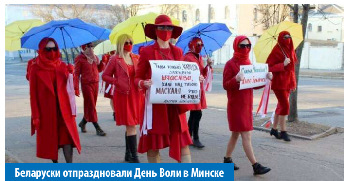
Беларуски отпраздновали День Воли в Минске