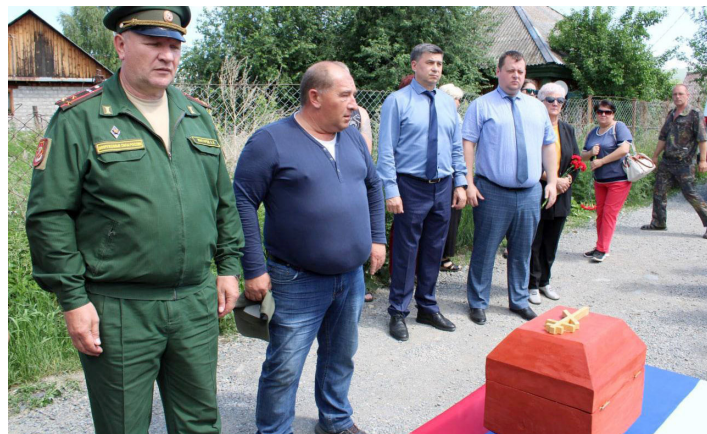
Алтай, июнь 2022. Похороны останков российского военного, ликвидированного в Украине

избегайте отправки на фронт любыми способами. Если не сможете избежать — дойдите до территории Украины и там попытайтесь незаметно уйти из части. Ищите контакты с местными жителями или украинскими военными, чтобы сдать в плен. При встрече с ними поднимите руки. Плен лучше смерти. В худшем случае (в Беларуси) вам грозит пару лет за побег. Но это лучше, чем братская могила или оторванные ноги. Нет ничего стыдного отказаться от участия в ТАКОЙ войне и сдать в плен. Потому что нападать на Украину — это НЕ защита Родины, это нападение на другую страну и преступление!