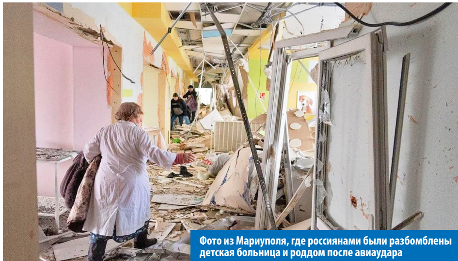
Фото из Мариуполя, где россиянами были разбомблены детская больница и роддом после авиаудара

проблема: мы не сможем производить и покупать элементарные средства гигиены, такие как туалетную бумагу и прокладки. Оказывается, делать туалетную бумагу — это не патроны клепать. Санкции продолжатся, и в скором времени у нас не будет ни одежды, ни еды... всё это, или материалы для их производства, мы, оказывается, закупает в «недружественных» странах.