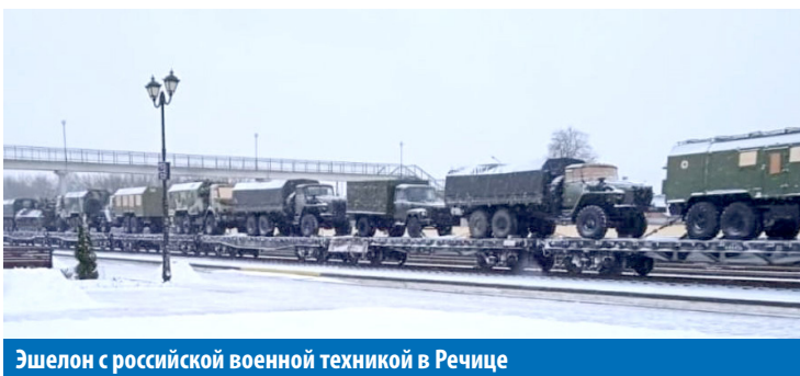
Эшелон с российской военной техникой в Речице

ред.). В какой-то момент другие посетители бара им начали подпевать. А потом люди подходили,жимали им руки. Всё это вышло спонтанно. Нет, у нас большинство всё-таки против войны.