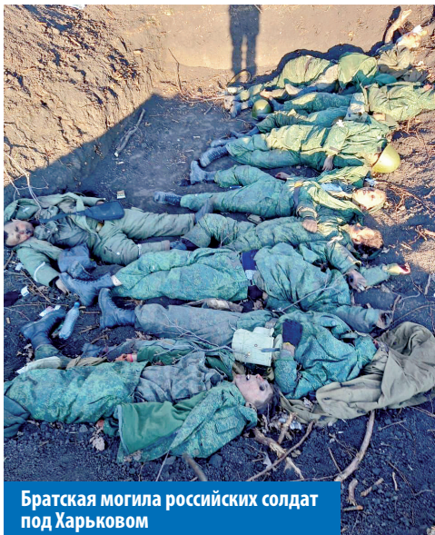
Братская могила российских солдат под Харьковом

И вообще белорусы никогда в истории не воевали с украинцами! В отличие от воюющих российских солдат из сибирских деревень или дагестанских аулов, почти у каждого белоруса в Украине есть родственники или знакомые. Разве они нам враги? ►