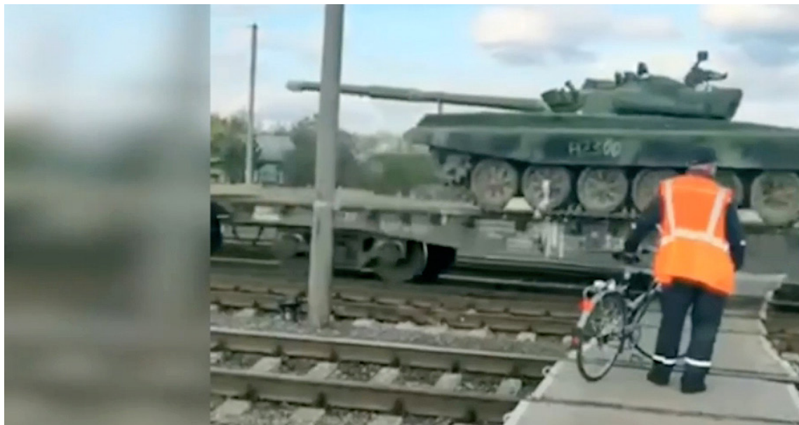
Эшелон в направлении Донецка, снятый в октябре 2022 года. Скриншот видео.